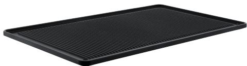
Grill side El lado de la parrilla